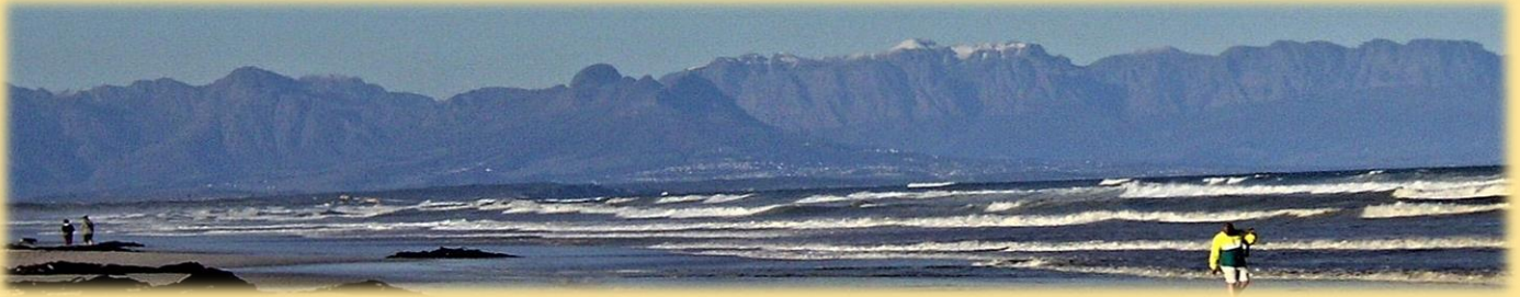
Schnee auf den Bergen